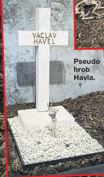
Pseudo hrob Havla.