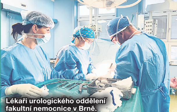
Lékaři urologického oddělení fakultní nemocnice v Brně.

Jeden mililitr vody je ve speciálním přístroji změněn v páru. Poté je při teplotě 70 stupňů zavedena do penisu. Zákrok trvá v řádu sekund. Metoda je málo invazivní, nepoškozuje tedy nijak vnitřní orgány. Výsledek se dostaví cca 3 až 4 týdny po zákroku.