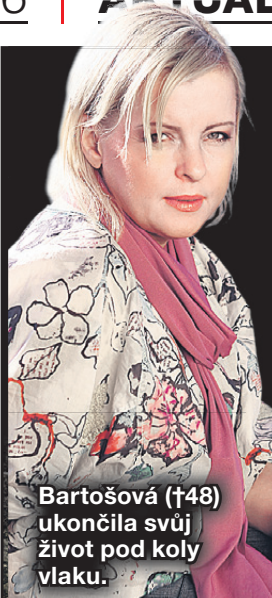
Bartošová (†48) ukončila svůj život pod koly vlaku.